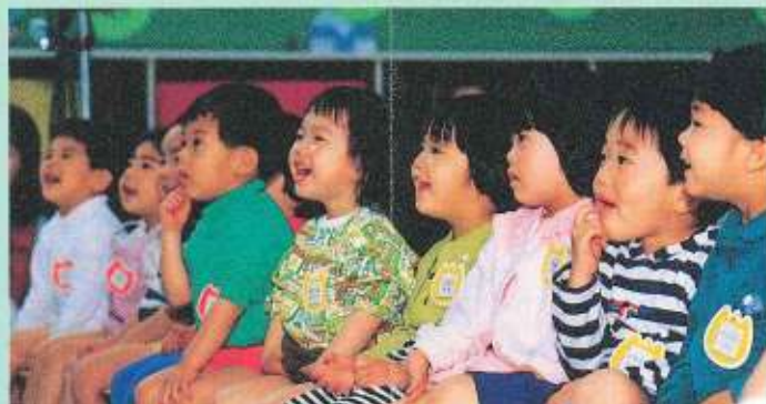
舞台を見つめる子どもたち。