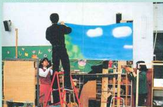
舞台もちろん、自分たちの手づくりだ。ローリングで幕に応じて、背景が変わるようにできている。