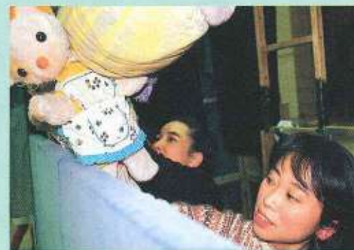
人形の巧みな動きに合わせて、相互に腕を交わす。