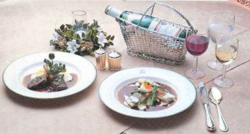
(左)仔羊のノワゼット エストラゴン風味 ¥3,000 (右)三種の魚のポワレー 赤ワイン風味 ¥3,400 ほかに、ランチ・スペシャル(コース) ¥2,500 など