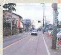
砂川三番の交差点 昭和36年頃