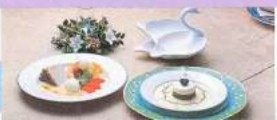
華麗なデザート(デザート)から (左)グラン・デザート ¥1,000 (右)ドゥー・ムース ¥500

昨秋、生まれたばかりのリーセント・パークホテル 2Fに「イル・モンド」という、おしゃれで本格的フランス料理が登場、味にうるさい貴方の「評価」を待っている。嶋田ジェフがバリてきたえ腕を、立川で花開かんとする志を達成させるのもまた「立川人」と云えようか。富士見町2丁目 ☎26-3111代