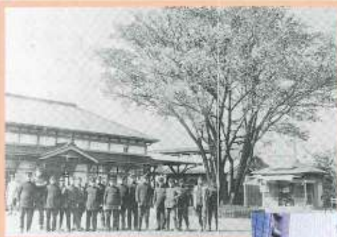
▲立川駅北口(本校がある) 明治40年頃